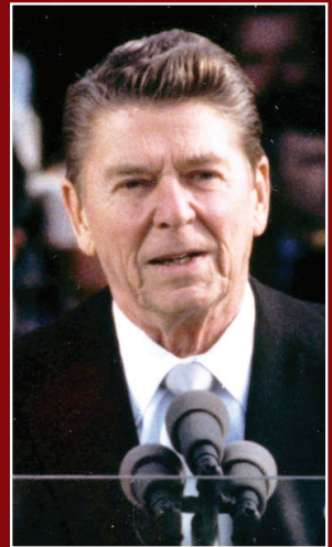
—Ronald Reagan 15 de Julio de 1991

“Nuestros documentos fundacionales proclaman al mundo que la libertad no es prerrogativa única de unos cuantos escogidos. Es el derecho universal de todos los hijos de Dios.”