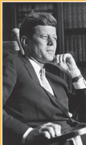
John F. Kennedy Presidential Library and Museum

“Que toda nación sepa, nos quiera bien o mal, que pagaremos cualquier precio, soportaremos cualquier carga, nos enfrentaremos a cualquier dificultad, apoyaremos a todo amigo, nos opondremos a todo enemigo, para garantizar la supervivencia y el éxito de la libertad”.